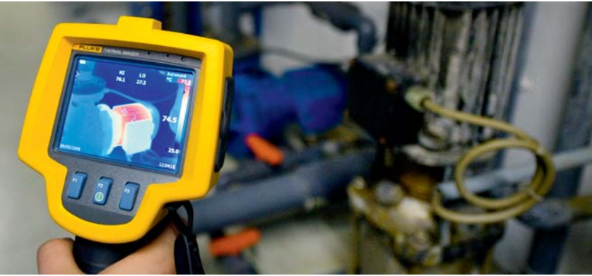
Wärmebild eines Motors