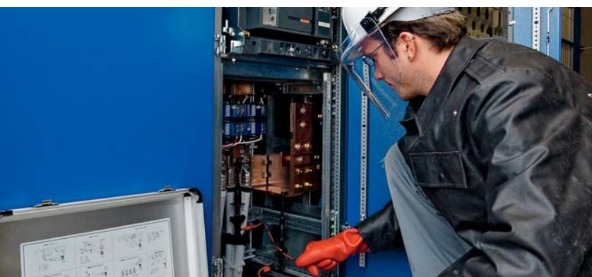
Messung hoher Kurzschlussströme