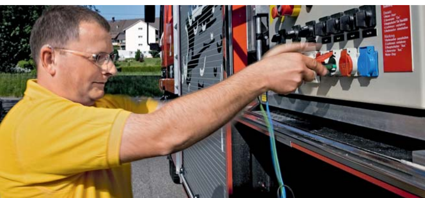
Funktionskontrolle einer Notstromversorgung